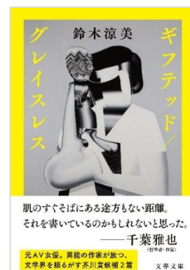
『ギフトッド／グレイスレス』 鈴木 涼美【著】文藝春秋