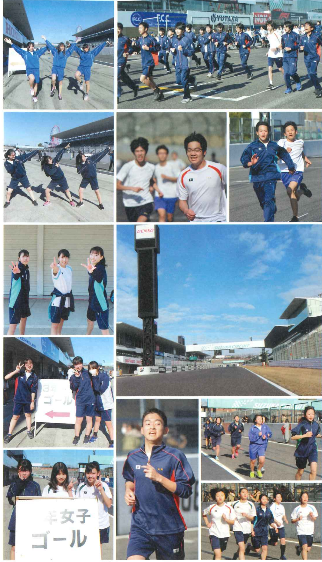
令和初のマラソン大会。鈴鹿サーキットのレーシングコースから緊張を胸に スタートした1~5年生の生徒たち。 当初、雨予報だった雲を吹き飛ばし、流れる汗とともに男子5.8km、女子4.4km を晴天の中、次々ゴール！走りぬぎました。