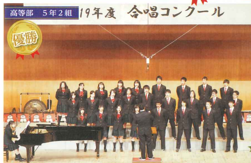
高等部 5年2組 19年度 合唱コンクール