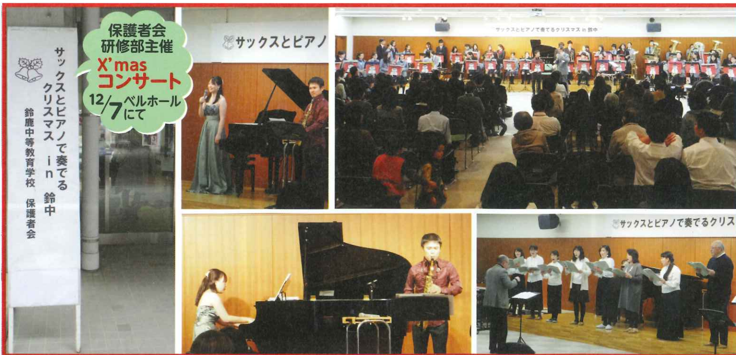
保護者会 研修部主催 X'mas コンサート 12/7ベルホール にて サククスとピアノで奏でる クリスマス in 鈴中 鈴鹿中等教育学校 保護者会