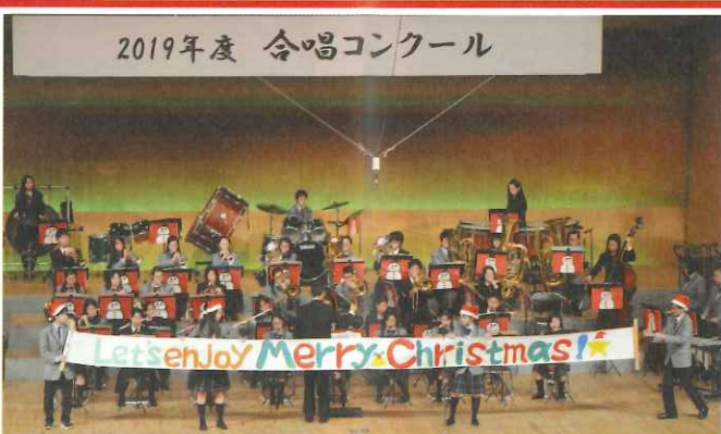
2019年度 合唱コンクール