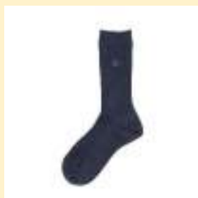
▲レギュラーソックス 720円（税込）