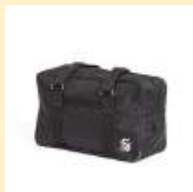
○通学用 ポストンバッグ 4,500円（税込）