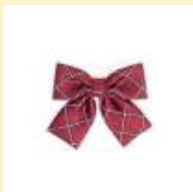
○リボン（エンジ） 2,300円（税込）