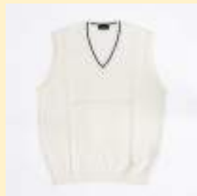
▲ニットベスト （白） 6,200円（税込）