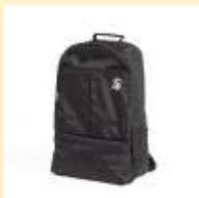
○通学用 リュック 7,000円（税込）