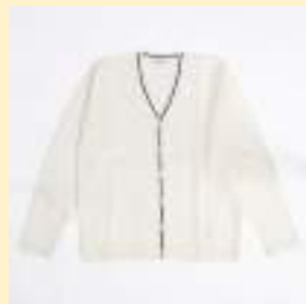
▲カーディガン （白） 8,200円（税込）