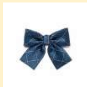
○リボン（ブルー） 2,300円（税込）