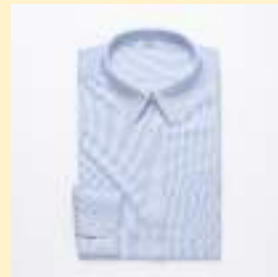
◎長袖ブラウス 3,900円（税込） 推奨枚数：2枚