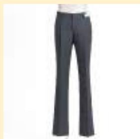
◎冬スラックス 10,800円（税込）