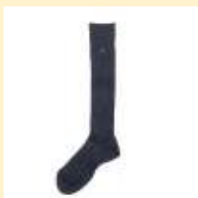
▲ロングソックス 720円（税込）

ソックスは自由（色は紺色）ですが、マーク入りソックスをいずれか1足をお持ちいただくことを推奨いたします