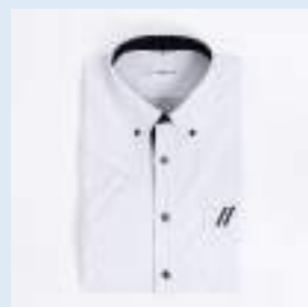
▲半袖シャツ（白） 5,200円（税込）