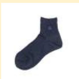
▲ショートソックス 720円（税込）