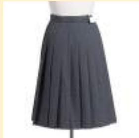
○冬スカート 11,500円（税込）