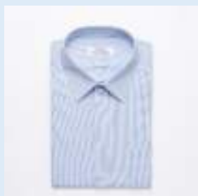
▲半袖シャツ 3,800円（税込） 推奨枚数：2枚