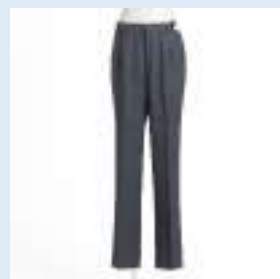
▲夏スラックス 12,600円（税込）