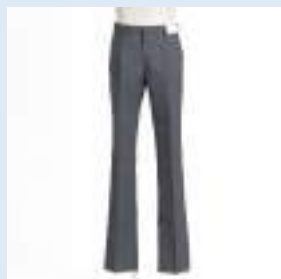
▲夏スラックス 10,200円（税込）