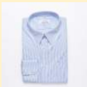
◎長袖シャツ 4,000円（税込） 推奨枚数：2枚