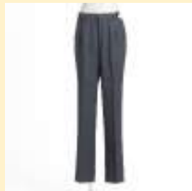
○冬スラックス 12,000円（税込）