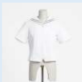
▲夏セーラー 8,300円（税込） 推奨枚数：2枚

ソックスは自由（色は紺色）ですが、マーク入りソックスをいずれか1足をお持ちいただくことを推奨いたします