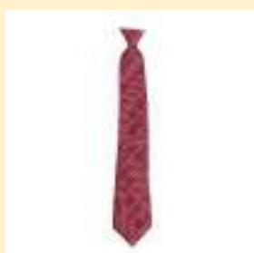
○ネクタイ（エンジ） 2,600円（税込）