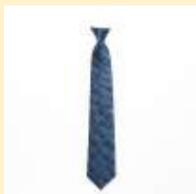
○ネクタイ（ブルー） 2,600円（税込）