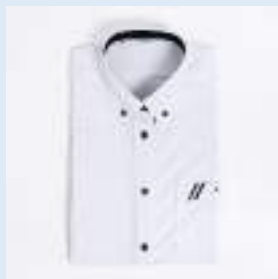
▲半袖ブラウス（白） 5,100円（税込）