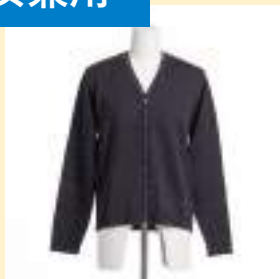
▲カーディガン （紺） 8,200円（税込）