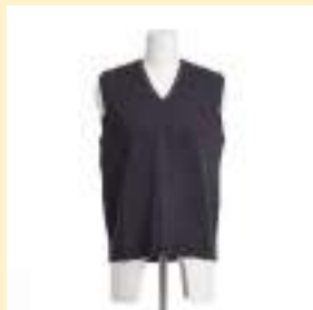
▲ニットベスト （紺） 6,200円（税込）