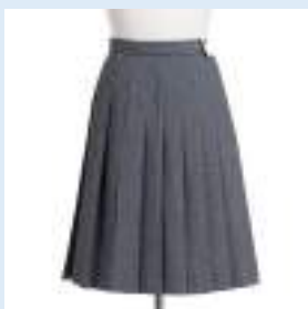
▲夏スカート 10,900円（税込）