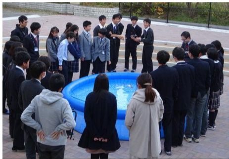
他校の生徒や大学の教授等を招いたイベント企画