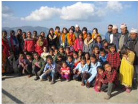
ネパールの福祉施設を訪問