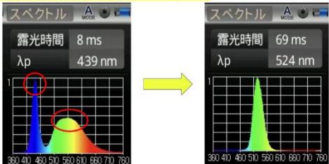
分光計で確認した光のスペクトル