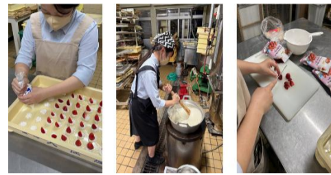
インクルーシブマルシェ