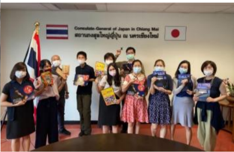
タイ 象の保護活動研究等